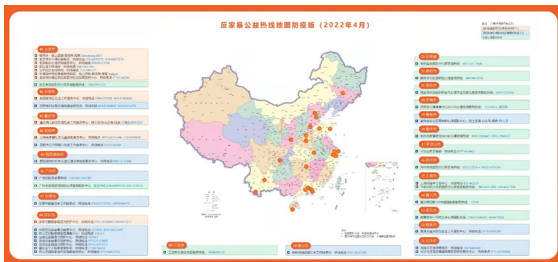
反家庭暴力服务地图，联合国妇女署与深圳市鹏星家庭暴力防护中心联合制作

2022年，联合国妇女署和中华人民共和国最高人民法院签署了谅解备忘录，共同推动《反家庭暴力法》的有效实施，加强以幸存者为中心的家庭暴力案件审理。为了落实这一备忘录，我们支持了中华人民共和国最高人民法院的直属单位——中国应用法学研究所的工作，支持其开发中国涉家庭暴力案件审理的典型案列，并通过对国际公约和标准的分析，推动以幸存者为中心的案件审理实践。